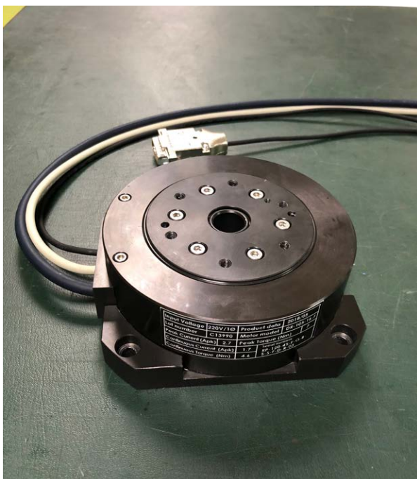
미니 로터리 플랫폼 분야의 ATOM 옵티컬 엔코더

그는 다음과 같이 덧붙입니다. “품질 관리를 위해 Renishaw XL-80 레이저 간섭계를 사용해서 모션 제품의 정확도를 확인하며, 증가하는 주문과 신규 공장의 수요에 대처하기 위해 유닛을 추가하는 것도 고려 중입니다. 로터리 테이블에서 ATOM 판독 헤드를 사용하는 것 외에도 다른 Renishaw 엔코더들을 다양하게 사용하고 있습니다. 예를 들어 CPC의 리니어 플랫폼에서는 RGH 시리즈 엔코더를 사용하고 대형 로터리 테이블에는 RESOLUTE™ 앰솔루트 옵티컬 엔코더를 사용합니다. 또한 진공 환경에서 작동 가능한 옵티컬 엔코더 시스템도 테스트하고 있습니다.”